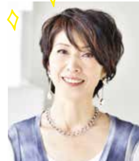
スペシャルゲスト 庄野真代 さん

すぎなみ舞祭のオリジナル総踊り曲第6弾『舞え、未来へ』(歌:庄野真代)を初披露! この日のために結成されたCedar★Youth90のメンバーが演舞します。