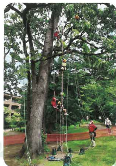
ツリークライミングは大人も見上げる高さ