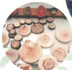
輪切りに絵を描こう

さまざまな体験型イベントに参加し、子どもも大人も思い思いに楽しむ様子が見られました。